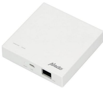
1x Basisstation (Gateway)

De basisset van Fysic leefstijlmonitoring (€149) bestaat uit het basisstation, een 2x deursensoren, rookmelder en een bewegingssensor.