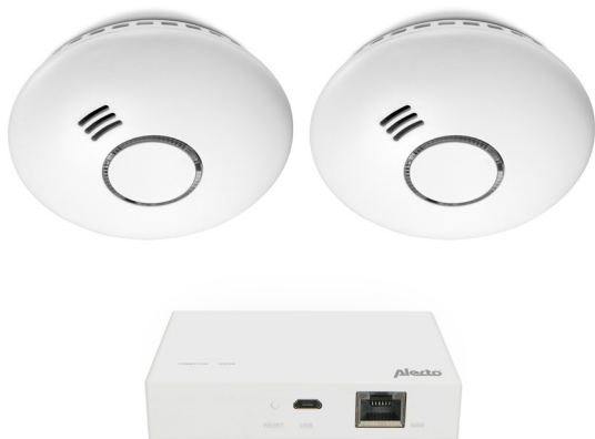
SMART-SMOKE10 SET 2