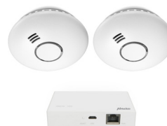
SMART-SMOKE10 SET 4