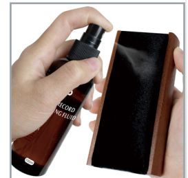
Record cleaning fluid spray